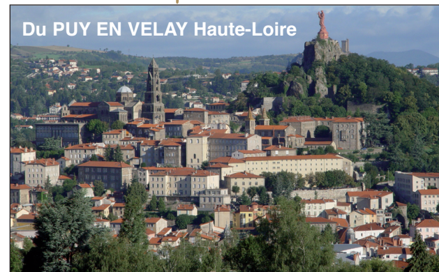
Sites classés au Patrimoine Mondial de l'Unesco.

ouvert à tous "Sportifs" et "Randonneurs"