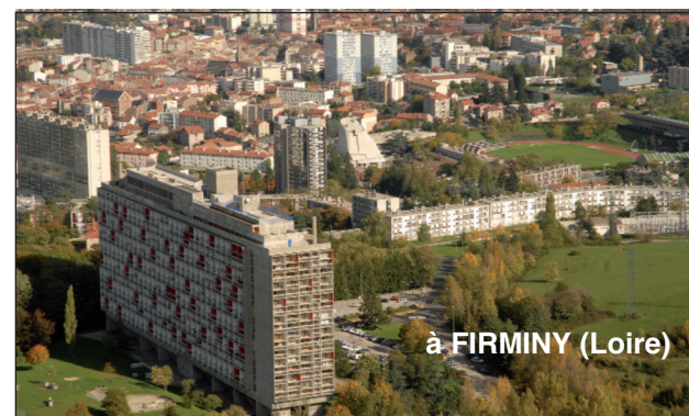
à FIRMINY (Loire)

Sites classés au Patrimoine Mondial de l'Unesco.